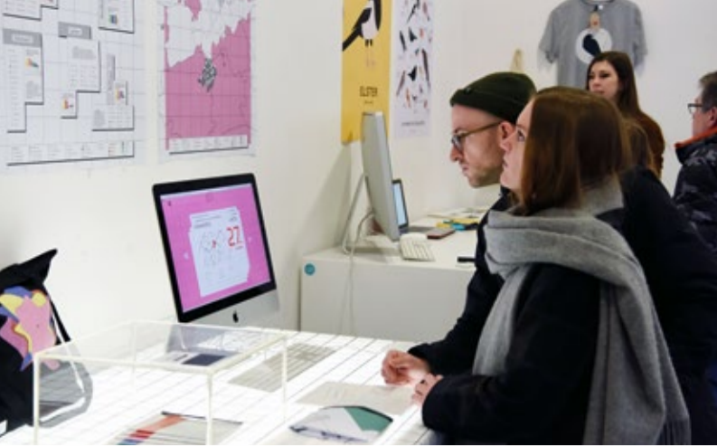
↑ Werkschau-Präsentation, Foto: Harald Koch ↓ Iris Ebert, Thesis Unigrafie ↘ Werkschau-Präsentation, Foto: Harald Koch → Titel: Marvin Frohn, Thesis pissed , www.pissed.wtf