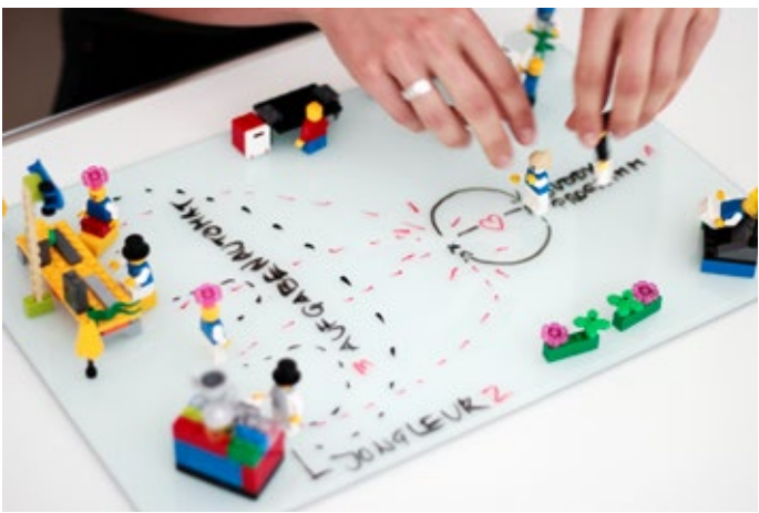
↑ → Design Thinking Workshop bei SAP, Fotos: Deborah Beuerle ↓ → Multidisciplinary Design Project, Foto: Lukas Rabenau