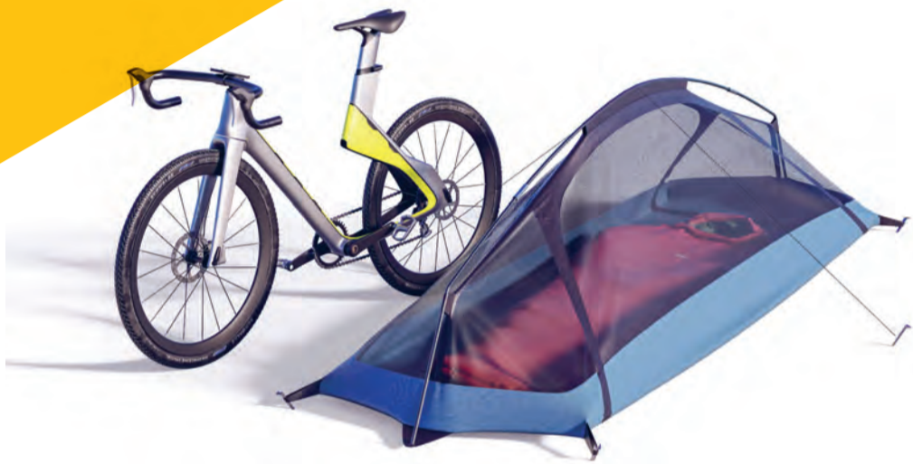
↑ Lukas Wenzhöfer, DAVON-Bike