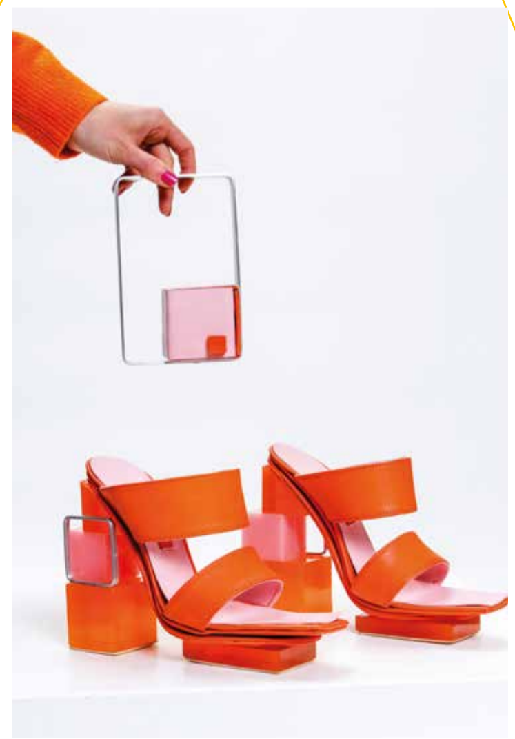
↙ Skizze von Franziska Eberle ↘ Julia Suppanz, our way of color

beantwortet unser StudiCenter unter der Nummer 07231 28 6724 oder per E-Mail an gestaltung.studicenter@hs-pforzheim.de . Individuelle Beratung zu konkreten studiengangsbezogenen Fragen geben die Akademischen Mitarbeiter*innen der Studiengänge.